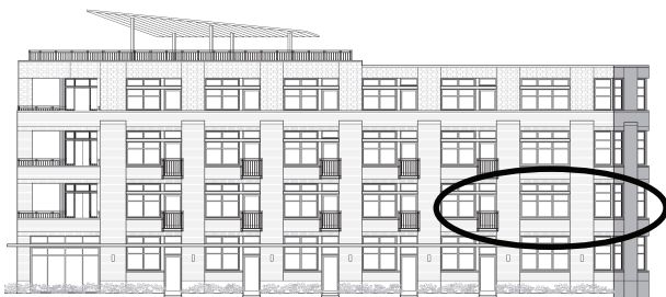
façade rue Rushbrooke